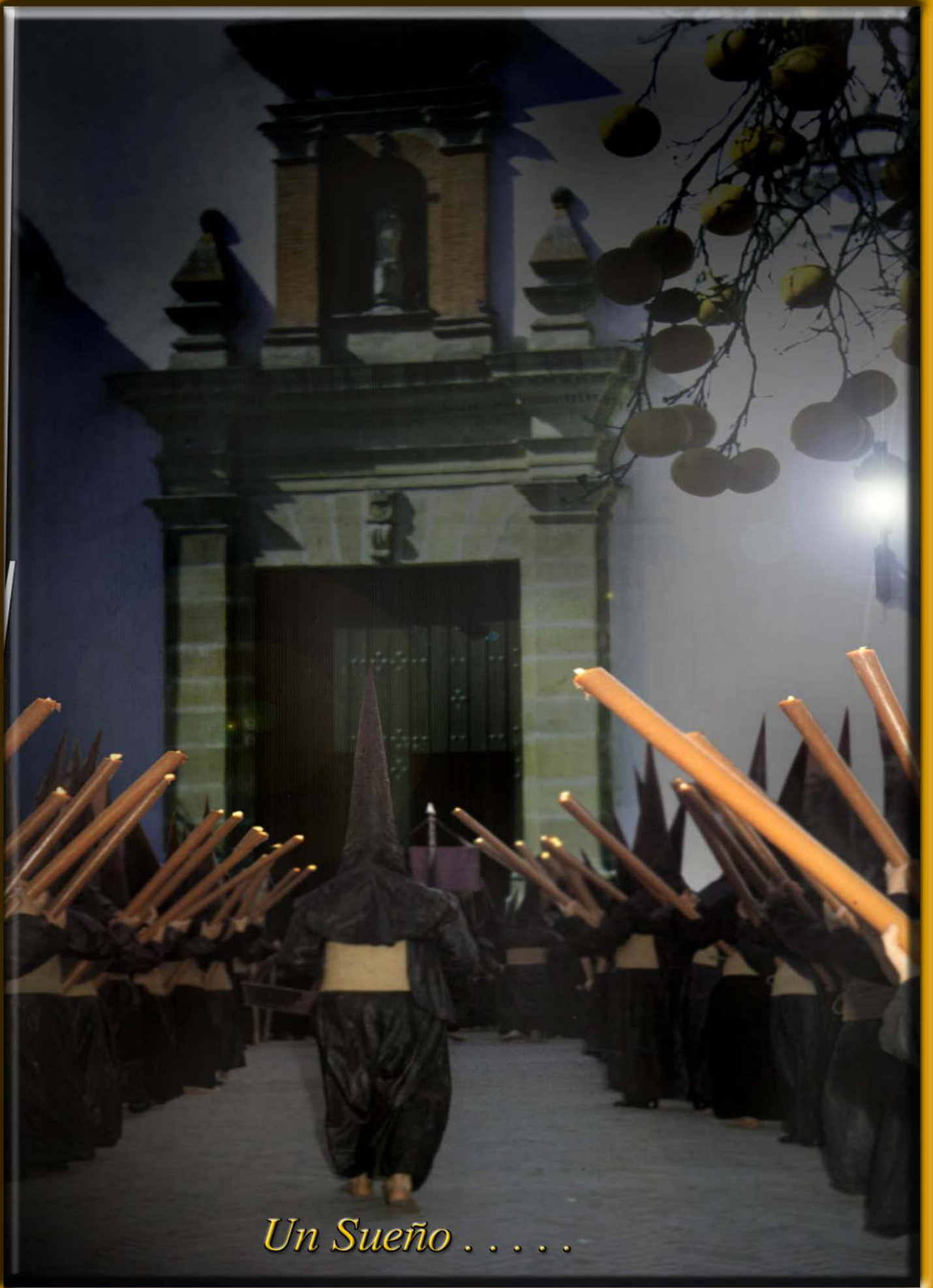
Un Sueño . . . . .