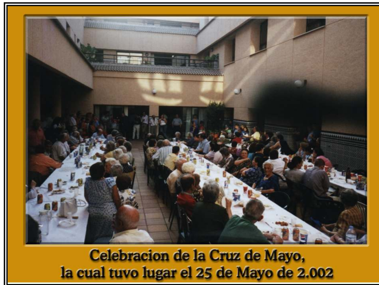
Celebración de la Cruz de Mayo, la cual tuvo lugar el 25 de Mayo de 2.002

El día 25 de Mayo de 2.002, tuvimos la oportunidad de comprobar como con tan poco esfuerzo se puede hacer feliz a tanta gente, como son los ancianos del hogar de San José que ese día pudieron disfrutar de una tarde amenizada por varios grupos musicales como son “Zalaitos”, “Solera Andaluza “ , “Coro María Auxiliadora”, “Coro rociero Ciudad de San Roque” y el grupo de baile “Aires de la Bahía”, además de una merienda que les hizo pasar al menos unas horas apartadas de su vida cotidiana y monótona.