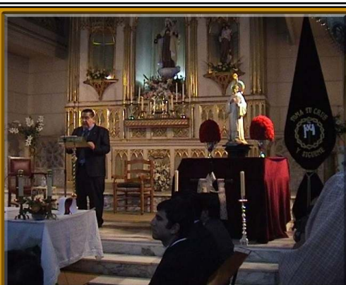
Eucaristia en honor a San Bernardo, celebrada el 20 Agosto 2002

Por último, después de haber leído éstas líneas, habréis observado el énfasis que le he dado al término PARTICIPACIÓN , la razón no es otra